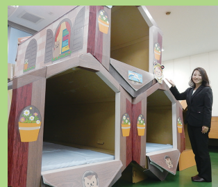
女性のアイデアが詰まった子ども用のカプセルルーム